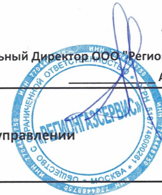
ГРАФИК проведения технического обслуживания внутриквартирного газового оборудования в г. Щелково М.О. в управлении "ДЕЗ ЖКУ" на май 2020 года. МУП ГОЩ

Утверждаю: Генеральный директор ООО "РегионГазСервис" А.Э. Грингоф